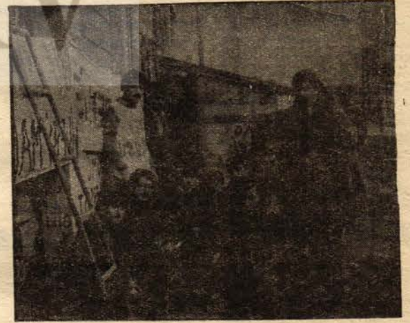
Muhabirimiz DE-KO işçileriyle sohbet ederken

DE-KO işçileriyle işçi sınıfının birliği meselesini de konuştuk. Bu birliğin hangi temelde, hangi hede-