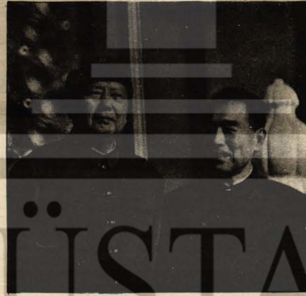
Cu En-Lay yoldaş Mao Zedung yoldaşla

Cu En-lay yoldaş yeni sosyalist olguları coşkuyla destekledi. Proletarya devrimi davasının haleflerinin yetiştirilmesine büyük bir önem verdi. Ayrıca edebiyat ve sanat, tıp ve sağlık işlerinde Başkan Mao'nun talimatlarının uygulanması için titizlikle mücadele etti. Daima